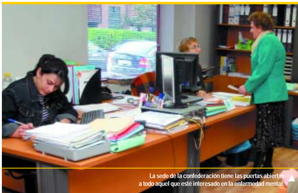
La sede de la confederación tiene las puertas abiertas a todo aquel que esté interesado en la enfermedad mental. ▲