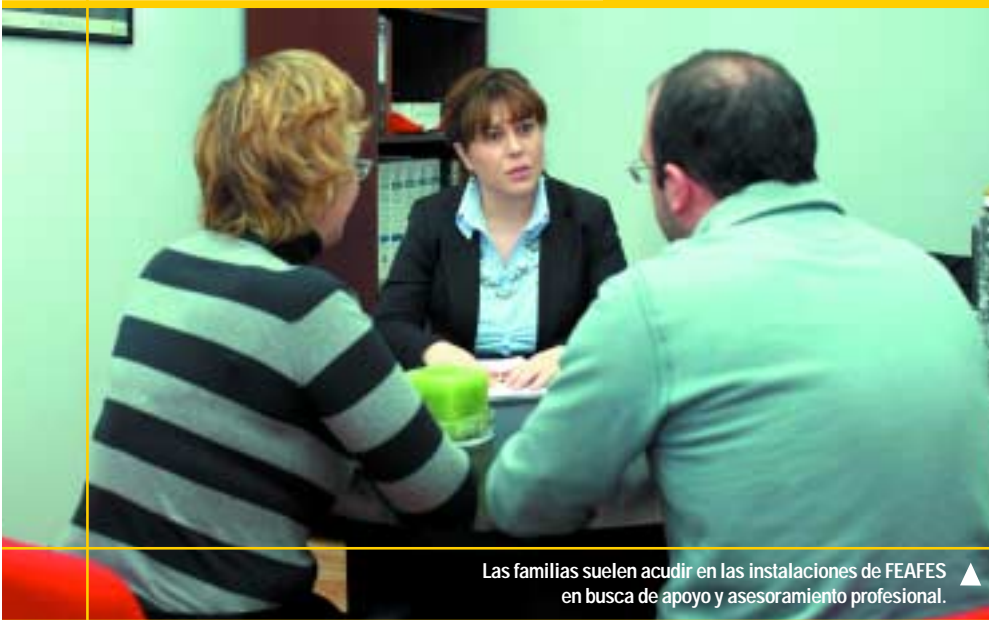
Las familias suelen acudir en las instalaciones de FEAFES en busca de apoyo y asesoramiento profesional. ▲

25 años han pasado desde la creación de FEAFES. España vivió en las décadas de los 60 y 70 años negros para la enfermedad mental. A estas personas se las ingresaba en hospitales psiquiátricos, que no paraban de construirse en todo el territorio nacional. Entre 1976 y 1981 se constituyeron las primeras asociaciones en Madrid,